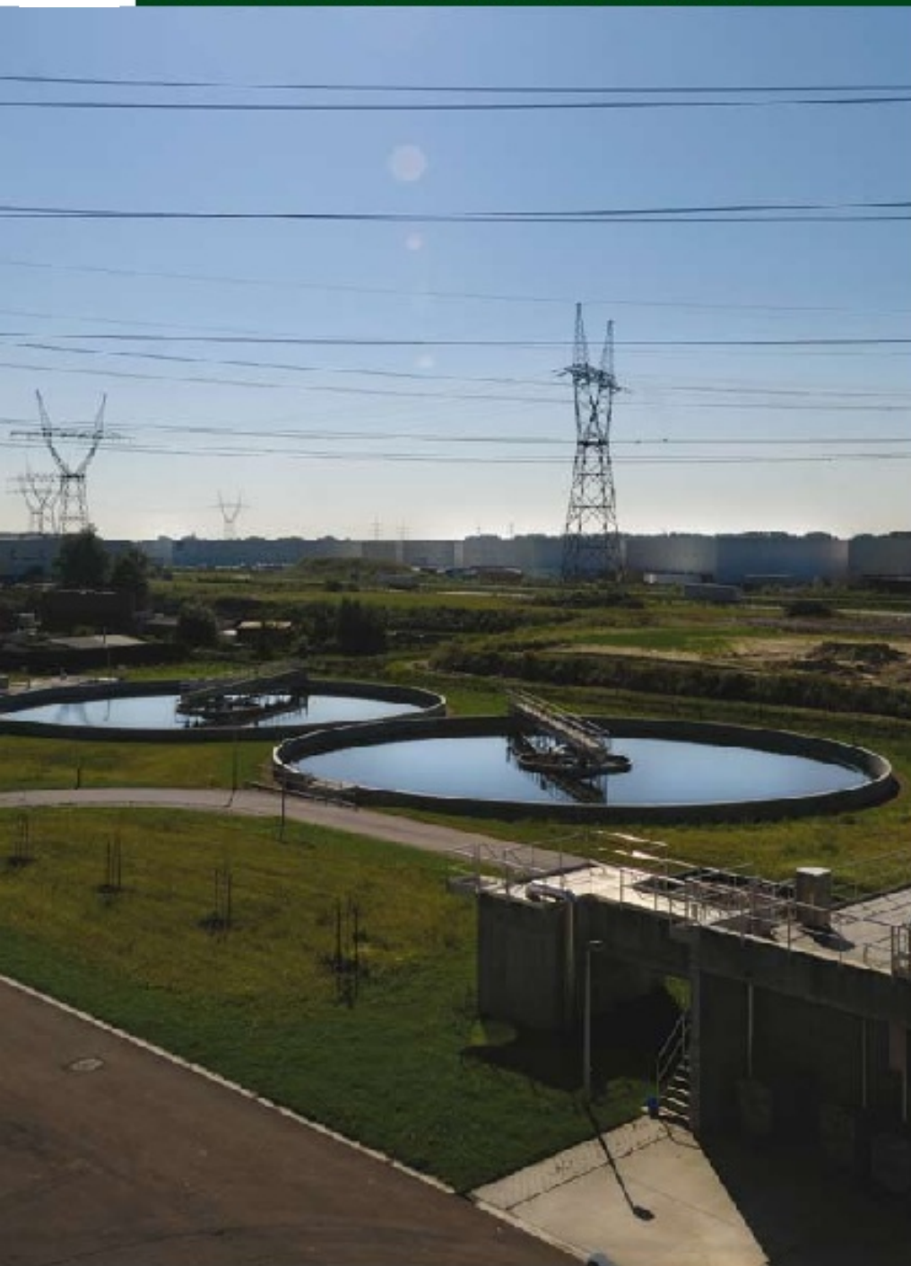
Het waterzuiveringsstation aan de Verbrande Brug in Grimbergen

J e kunt er moeilijk naast kijken ter hoogte van de Budabrug naast het kanaal Brussel-Schelde. De immense infrastructuur op de rechteroever is het volledig overdekte gebouw van de rioolwaterzuiveringsinstallatie (RWZI) Brussel-Noord. Deze zowat grootste installatie van West-Europa werd dit voorjaar officieel in gebruik genomen. Dagelijks wordt het afvalwater van 1,1 miljoen inwoners verwerkt. Op termijn is het ook de bedoeling om de Zenne en de Woluwe, samen met hun vele zijrivieren en -beken, zuiver te maken zodat ze opnieuw voldoende leven kunnen bevatten. Dat moet uiteindelijk leiden tot een propere Noordzee, want daar komt al ons water uiteindelijk in terecht. Om het doel van meer