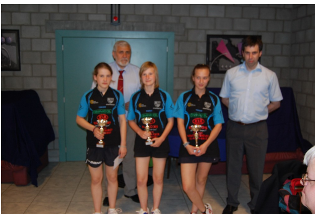
PW Diest A

Volledigheidshalve nog vermelden dat bij de mannen de finale gewonnen werd door Immo Mortsels met 4-5 tegen thuisclub Sokah Hoboken.