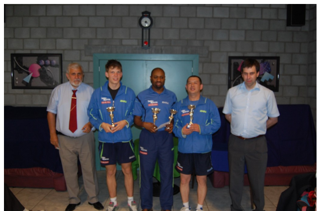
Immo Mortsels A