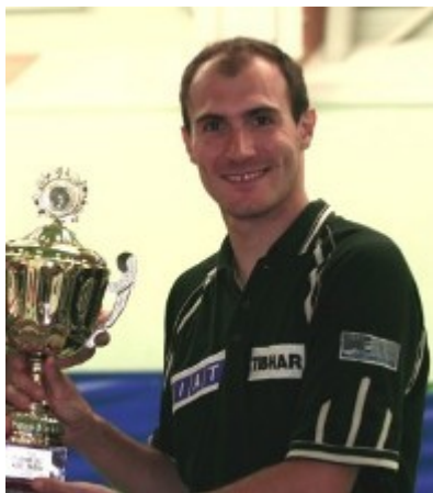
dit seizoen zowel actief in Frankrijk als in België.