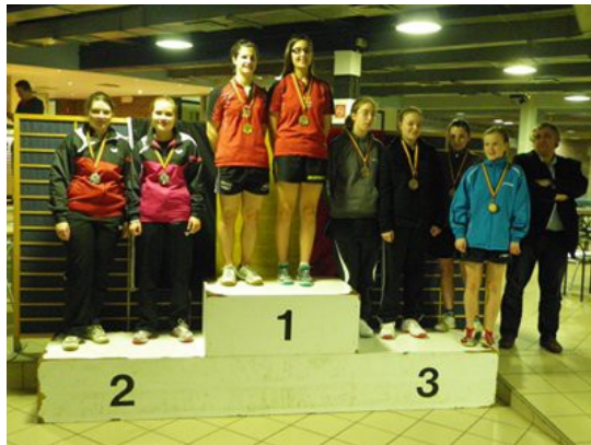
Belgische Kampioenen – Dames C