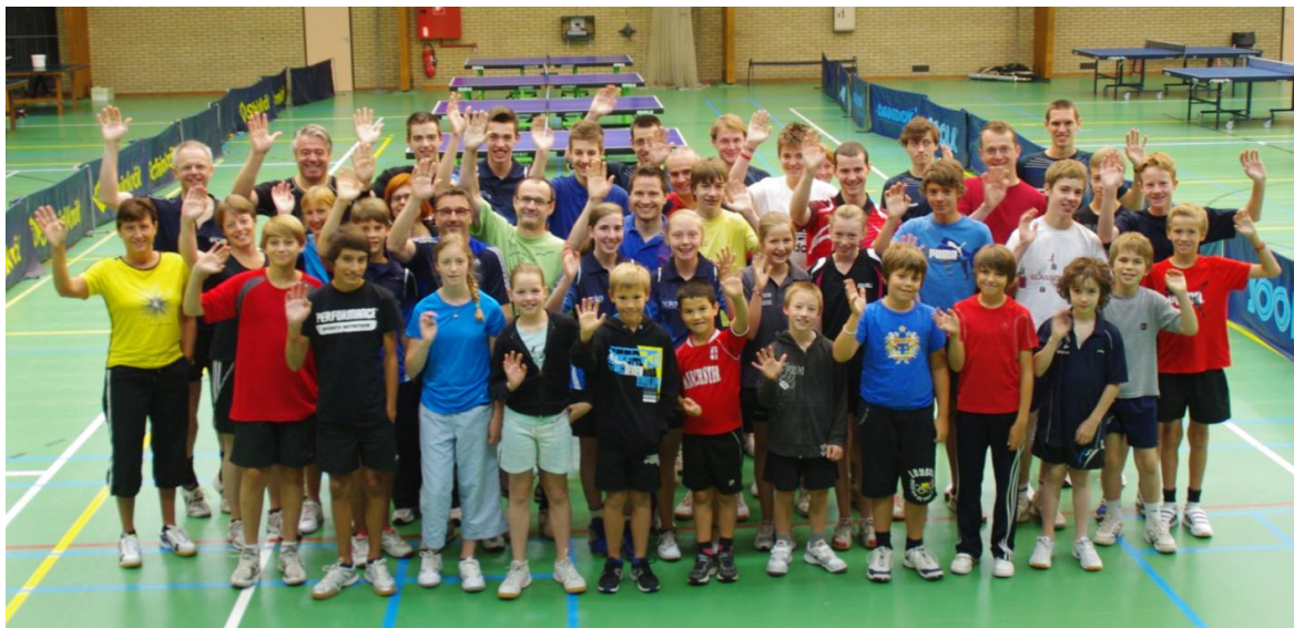
Editie 2012: 38 deelnemers (B, C, D, E en NG) tussen 7 en 58 jaar