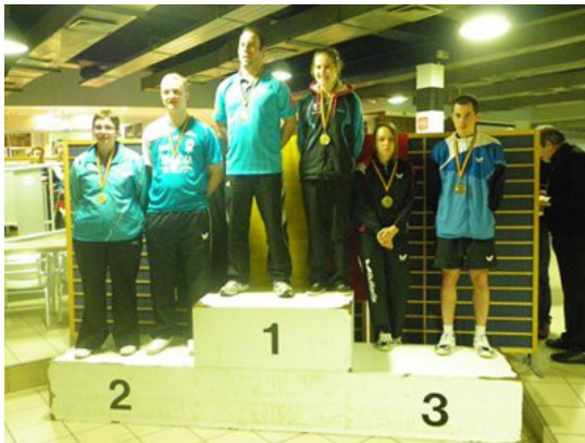
Belgische Kampioenen – Gemengd A