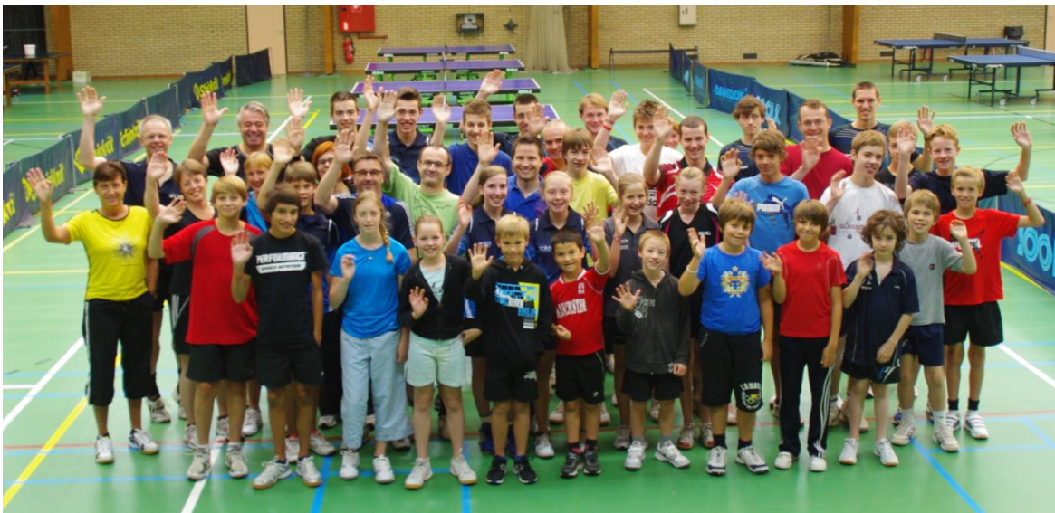
Editie 2012: 38 deelnemers (B, C, D, E en NG) tussen 7 en 58 jaar